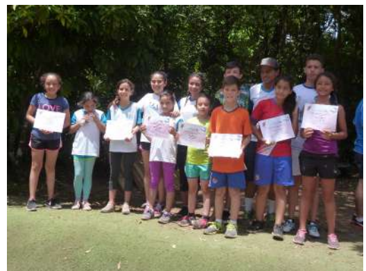
National student games

"Nature is not a place to visit. It is home" -Gary Snyder