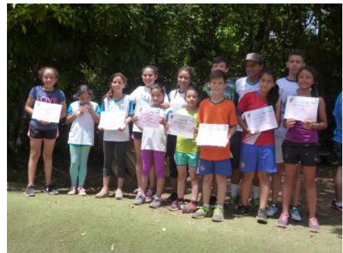
Juegos estudiantiles nacionales

Estamos buscando casas para personal nuevo y familias internacionales. Si conoces casas de alquiler en la zona por favor enviar un correo a opportunities@cecmonteverde.org o llamar a nuestra oficina.